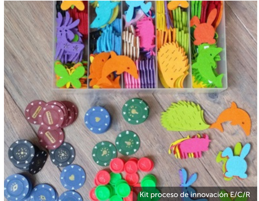
Kit proceso de innovación E/C/R

Para el ejercicio de diseño del proceso de innovación, hemos creado un kit donde, a través de fichas ( hitos, tomas de decisión y herramientas ) y animales ( roles ), el participante va configurando su propio proceso, guiado por el facilitador.