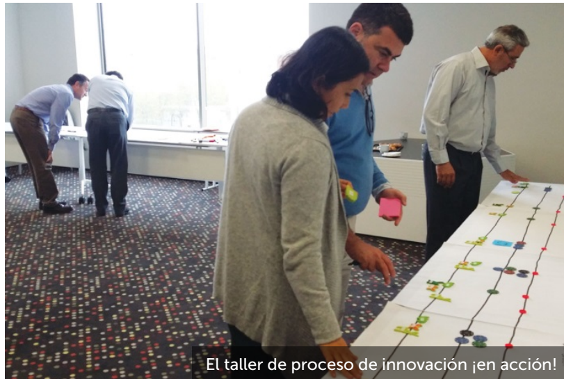
El taller de proceso de innovación ¡en acción!

Además, reforzamos todo el proceso de aprendizaje con recursos del coaching , la PNL y la inteligencia emocional . Y tenemos años de experiencia real en el uso de estas herramientas con clientes, no solo en formación sino también en consultoría , donde existe un alto grado de exigencia.